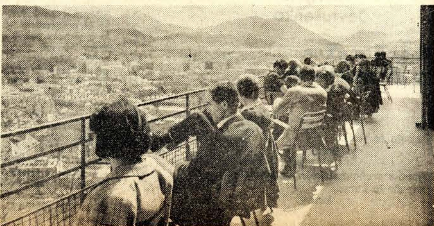
NA TERASE STUDENTSKÉ KOLEJE RABOT VYSOKO NAD GRE- NOBLEM ODPOČIVAJÍ STUDENTI NEKOLIK MINUT PRED DALŠÍ PREDNÁŠKOU