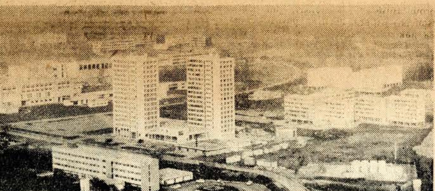
SATELITNÍ STUDENTSKÉ MĚSTO SAINT-MARTIN-D'HERÉS